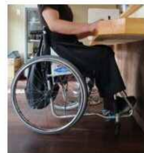
ローカウンターの設置