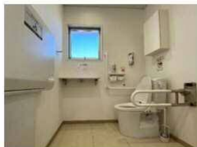
トイレのバリアフリー化