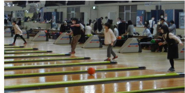
会員親睦ボウリング大会