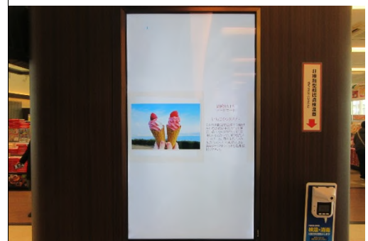
タブロイド誌「せとうちグルメ通信」（イメージ）